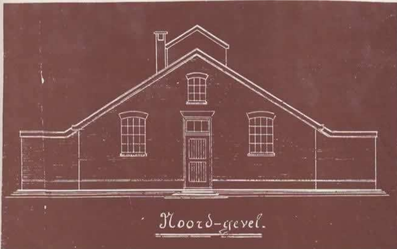
fragment van de bouwtekening uit 1915